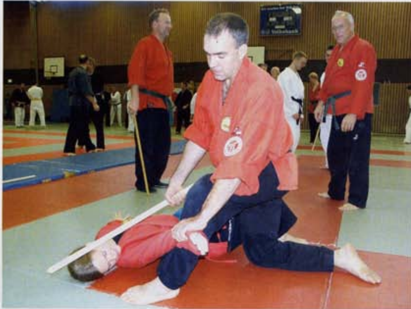
oben: Hanbo Jitsu